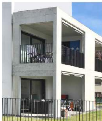
BALKONE SICHTBETON / GLASGELÄNDER