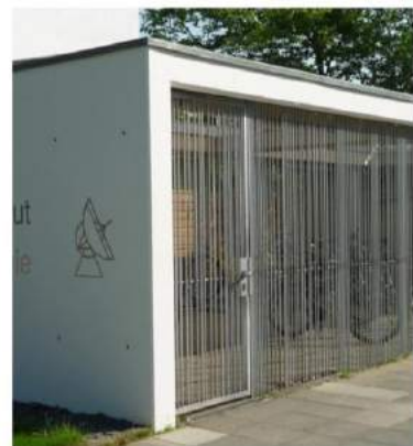
VELOS SICHTBETON / METALLVERKLEIDUNG