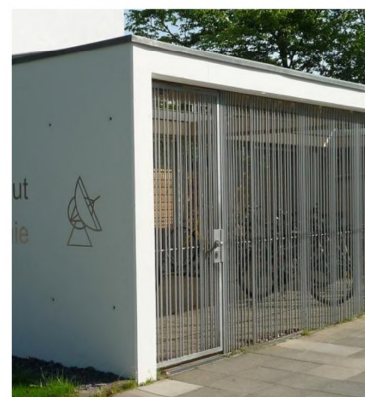
VELOS SICHTBETON / METALLVERKLEIDUNG