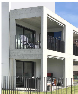
BALKONE SICHTBETON / GLASGELÄNDER